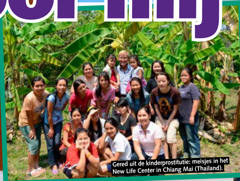
Gered uit de kinderprostitutie: meisjes in het New Life Center in Chiang Mai (Thailand).