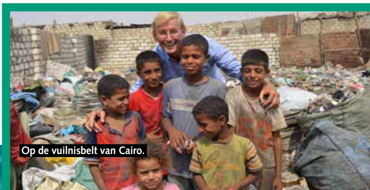
Op de vuilnisbelt van Caïro.